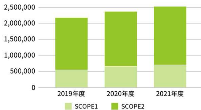
Scope1 + 2 排出量推移 (t-CO2)