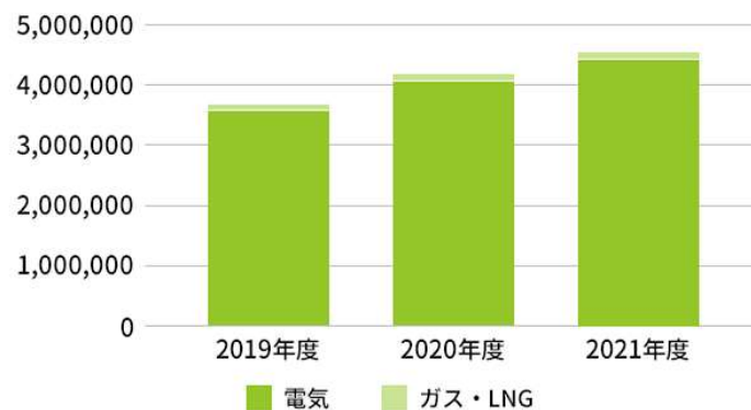
エネルギー使用量推移 (MWh)